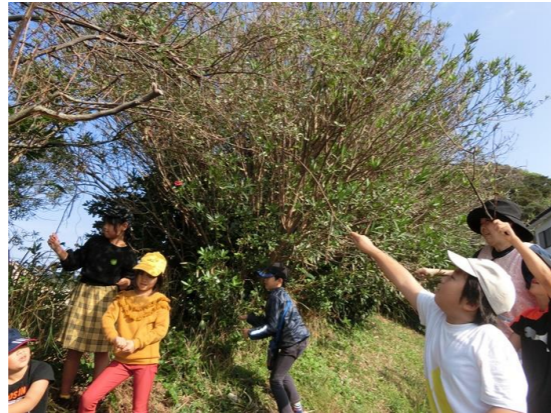
力を合わせてグミ取りに挑戦！！