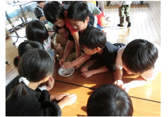
上は、みなを爪楊枝で抜きました 下は、みなのお味見 おいしい！！

すいぞくかんをつくりました。たのしかったです。こんどはにぎやかなすいぞうかんにしたいです。