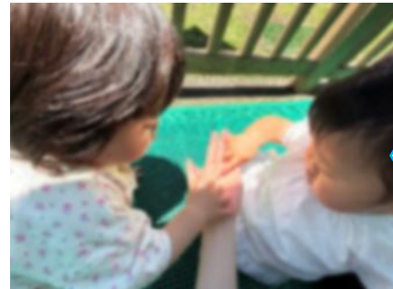
ダンゴムシみつけた!!